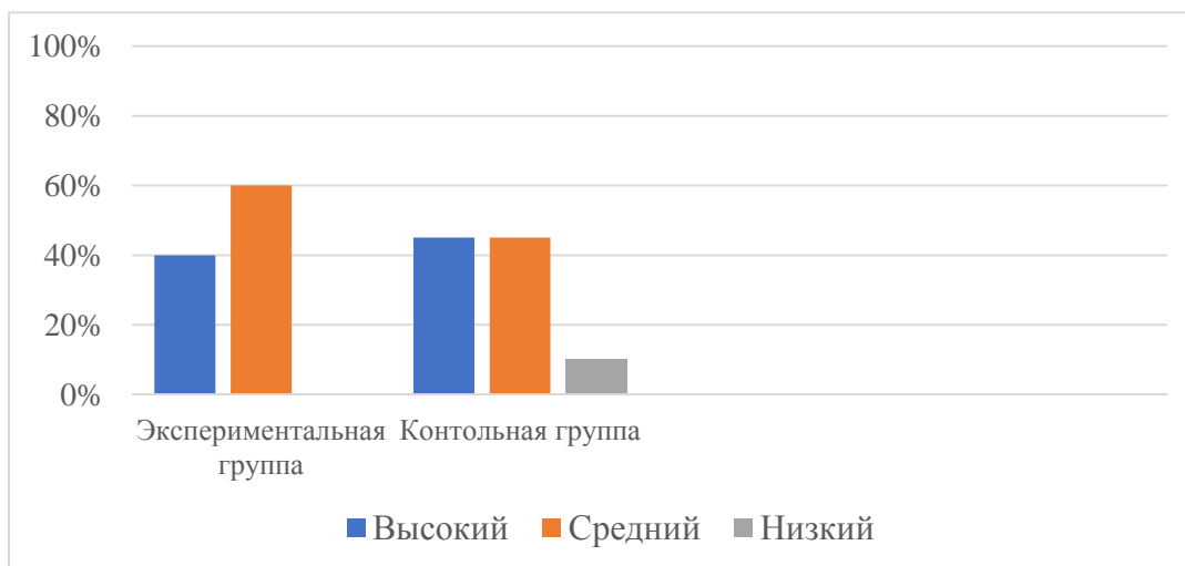
Рис. 1. Гистограмма уровня развития ловкости у детей старшего дошкольного возраста